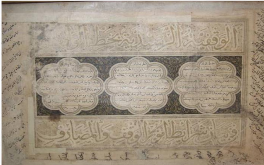
صك الوقفية الرشيدية لمركز الربع الرشيدي بخط الوراق

أسس رشيد الدين فضل الله الهمداني (٦٤٨هـ)، الطبيب والمؤرخ والوزير الإسلامي مركز الربع الرشيدي وكان الهدف من إقامة هذا الصرح إشاعة العلم بين الناس، فقد كان محباً للعلم وذا علاقة وطيدة بالعلم والعلماء.